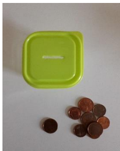
Une boîte à la fois.