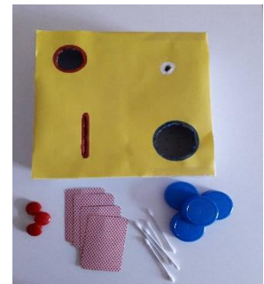
Une seule boîte avec plusieurs trous (ici avec indice visuel de couleur) .