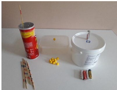
Plusieurs boîtes présentées en même temps, avec modèle.